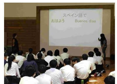
パオラさんのお話